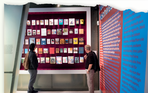
GrimmsMärchenReich in Hanau (oben) Brüder Grimm-Haus in Steinau (Mitte); GRIMMWELT Kassel (unten);