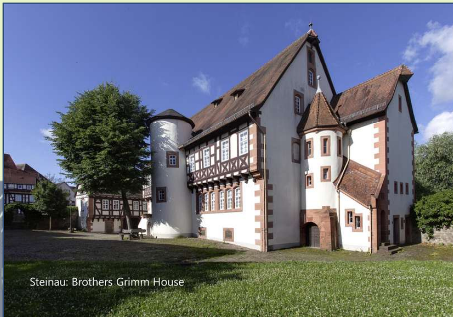
Steinau: Brothers Grimm House