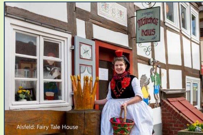
Alsfeld: Fairy Tale House

📍 Tourist Center Alsfeld · ☎ +49 (0)6631 182165 · ✉ tca@stadt.alsfeld.de